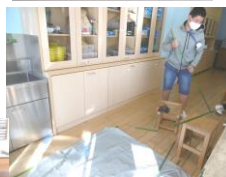
「自転車まるごと合羽」制作開始しました