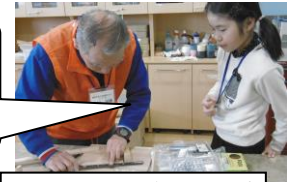
くるくるくまさんカップ

初めてドリルで穴をあけることができたが、セメンダインで木を接着した時になめになってしまった。