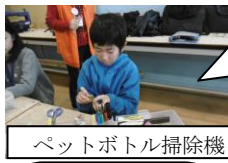
ペットボトル掃除機